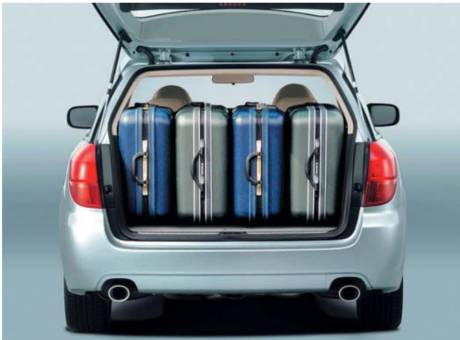
Subaru Outback si oblíbily také početnější rodiny díky jeho pohodlnosti a možnosti převézt i větší množství zavazadel