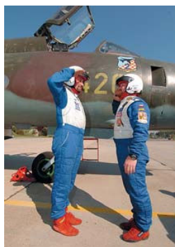
Při Horácké rallye si na letecké základně v Náměšti nad Oslavou kluci zahráli na vojáky